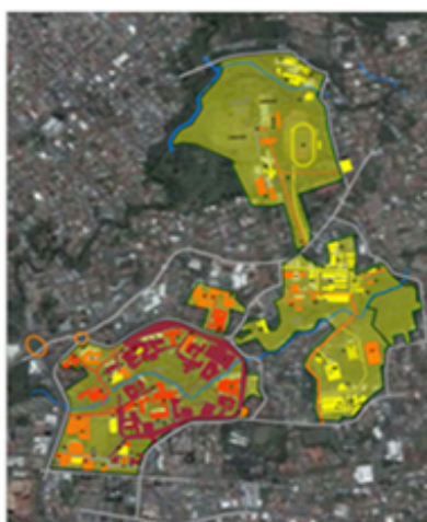
Universidad de Costa Rica: Localización Progresiva de Construcciones por Década. 1945-2007