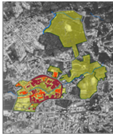
Universidad de Costa Rica: Sede Central, Análisis Fotográfico de las Tendencias de Uso del Suelo y Evolución Edilicia. 1976