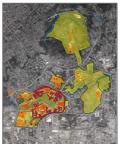
Universidad de Costa Rica: Sede Central, Análisis Fotográfico de las Tendencias de Uso del Suelo y Evolución Edilicia 1984