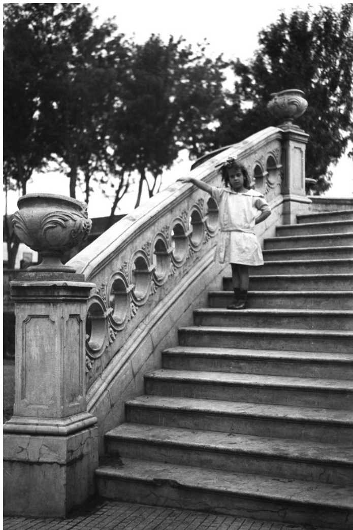
Imagen: Escalinata Antigua Fábrica de Licores, San José, Costa Rica, Biblioteca Nacional de Costa Rica.