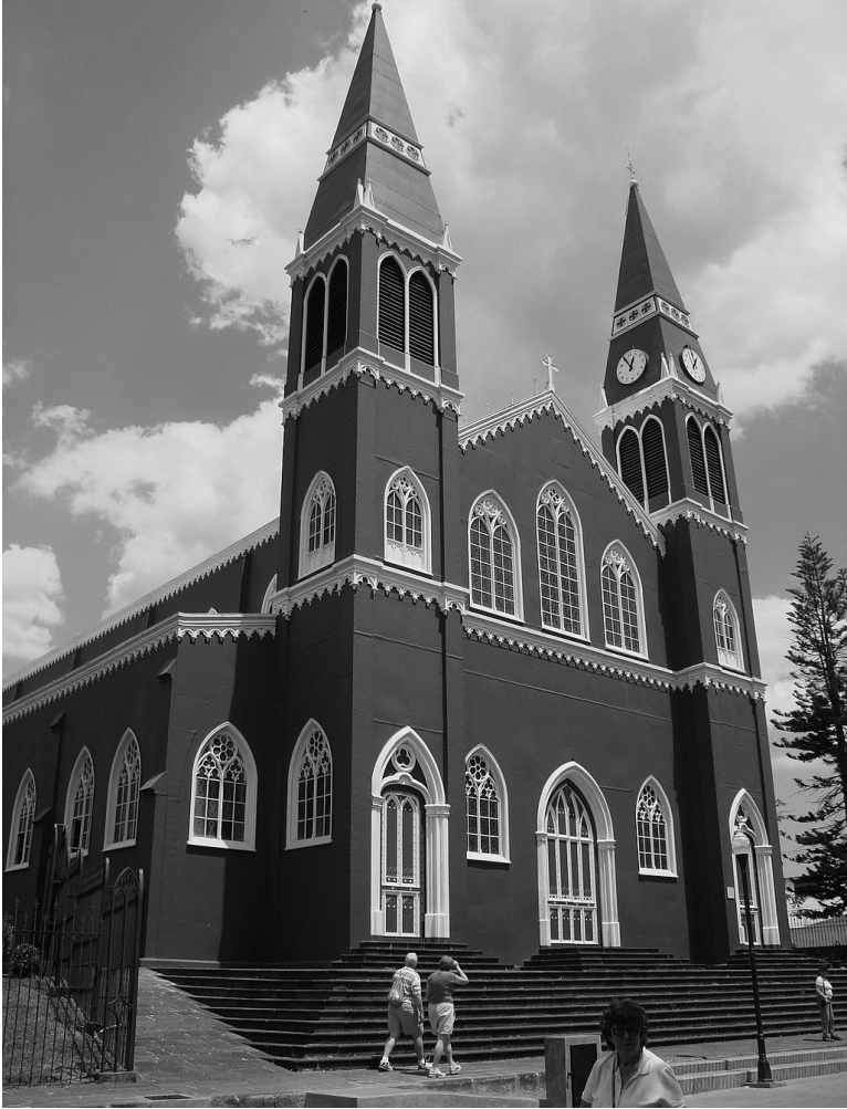
Imagen: Iglesia de Grecia, Alajuela, Costa Rica.