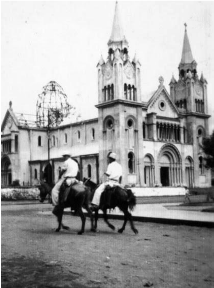
Imagen: Iglesia de San Ramón, Alajuela.