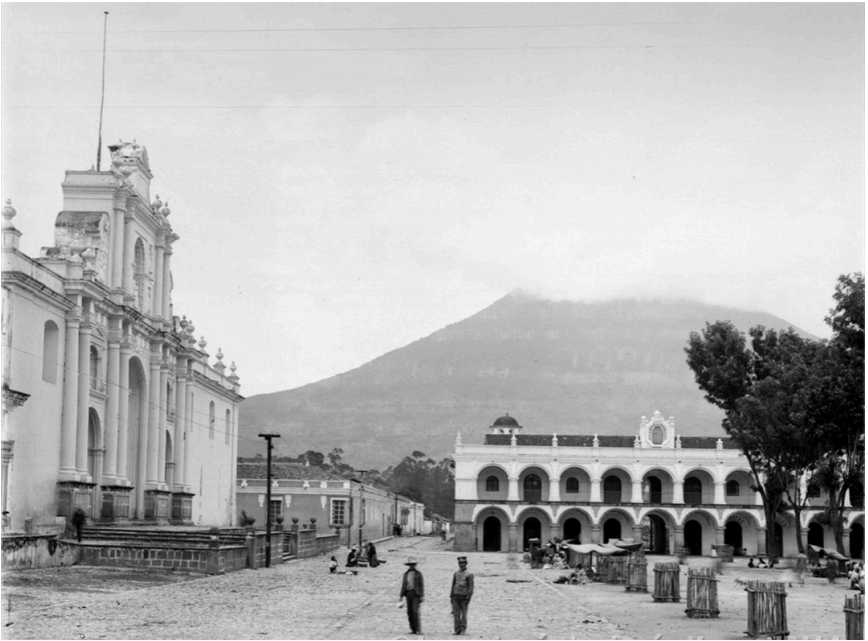
Iglesia San José Catedral, Juan José de Jesús Yas (1895), Fototeca de Guatemala

Adriaan C. van Oss, aborda la historia de la parroquia colonial y de sus arquitecturas eclesiásticas. El contenido del trabajo comprende también la jurisdicción de los nuevos territorios a la Corona Española y la transferencia del control de la iglesia por el Papa a la Corona, bajo el Patronato Real, que tuvo como fin expandir el imperio cristinario.