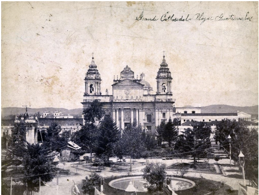
Imagen: Plaza de la Catedral, Guatemala, Edward J. Kildare, (1892), Fototeca de Guatemala .