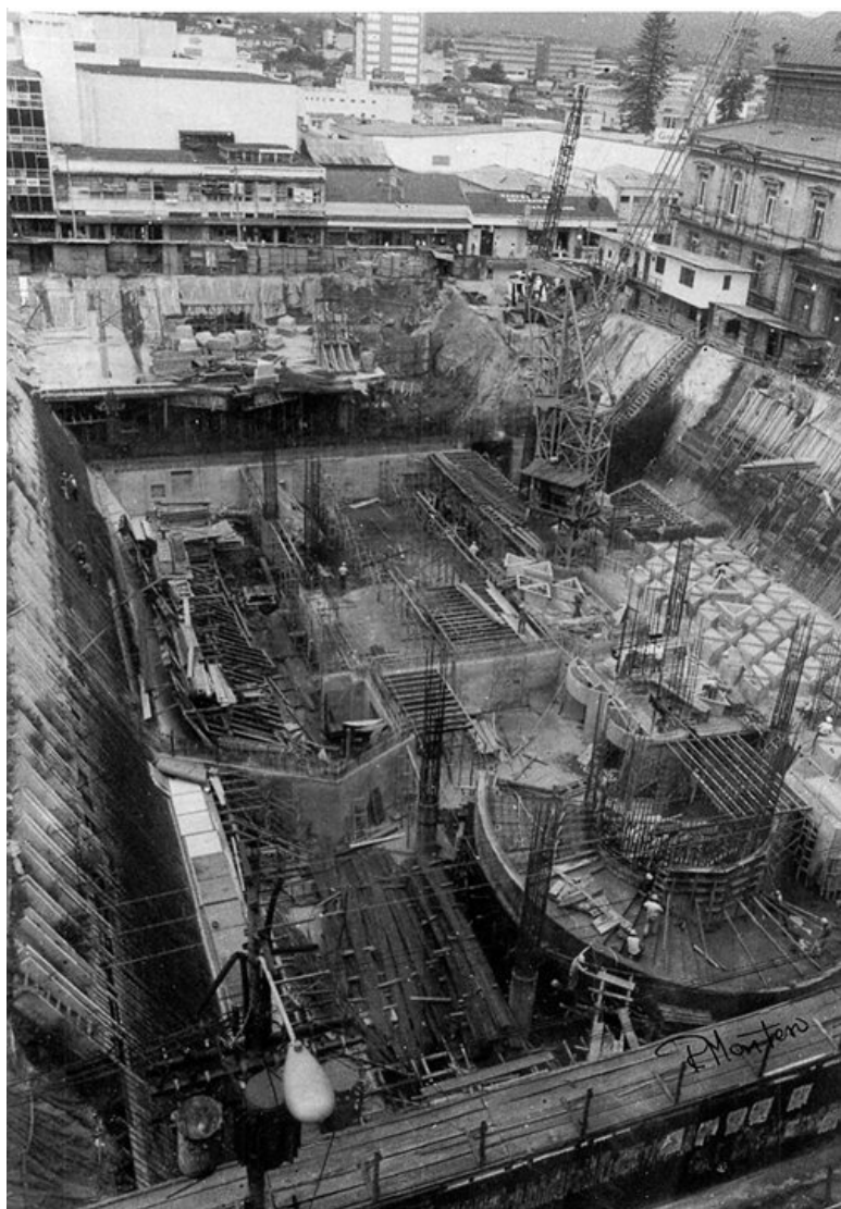
Imagen: Construcción Plaza de la Cultura y MBBCR (circa 1981), cortesía del MBBCR.