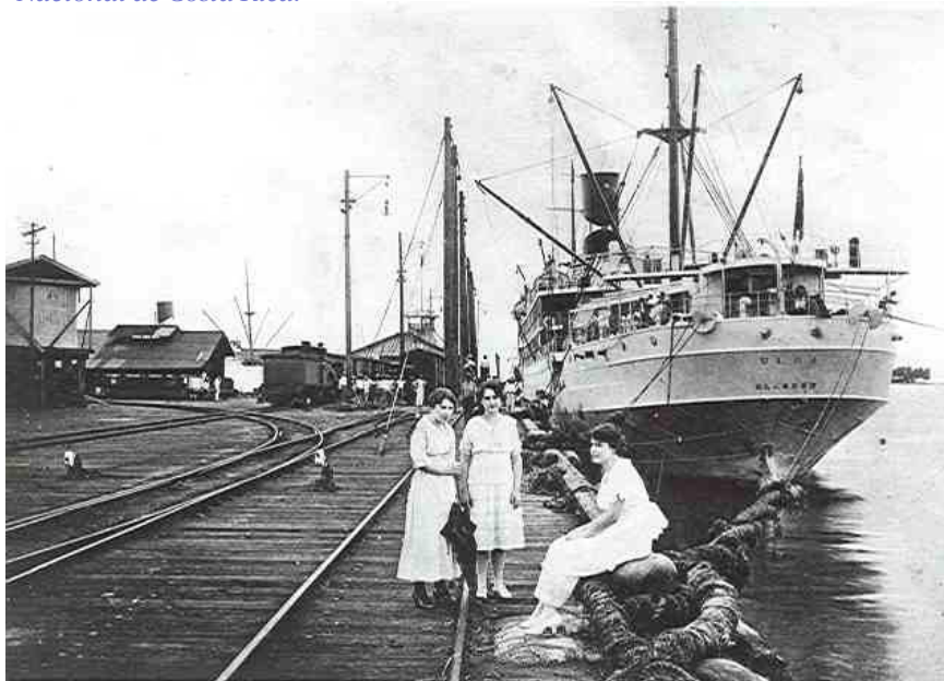
Imagen: Muelles de la United Fruit Company en Limón, Manuel Gómez Miralles, Archivo Nacional de Costa Rica

Imagen en la página anterior: Muelle de la United Fruit en Limón, Archivo Nacional de Costa Rica.