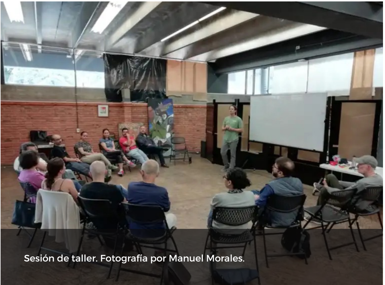
Sesión de taller.