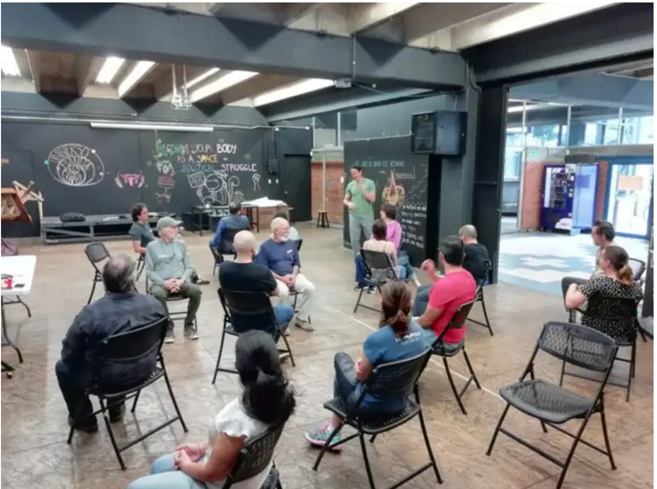
Poniendo en práctica técnicas grupales.

El taller tuvo como objetivo propiciar un espacio para la vivencia -y co-creación- de técnicas grupales que nos posibiliten aprender y compartir herramientas para ser mejores personas facilitadoras de procesos grupales en diversidad de contextos.