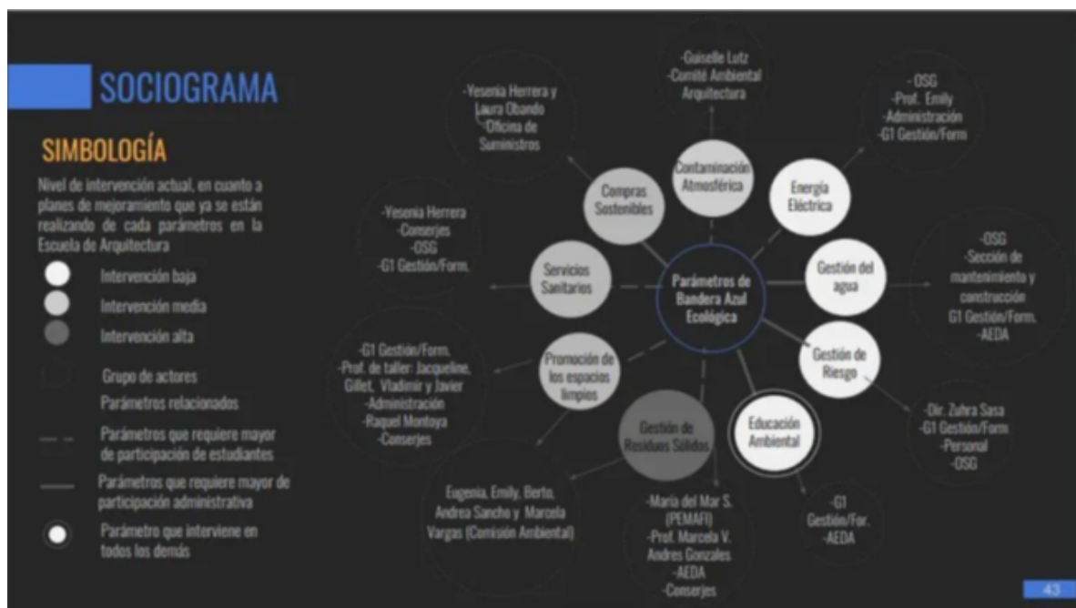
Sociograma del proyecto.