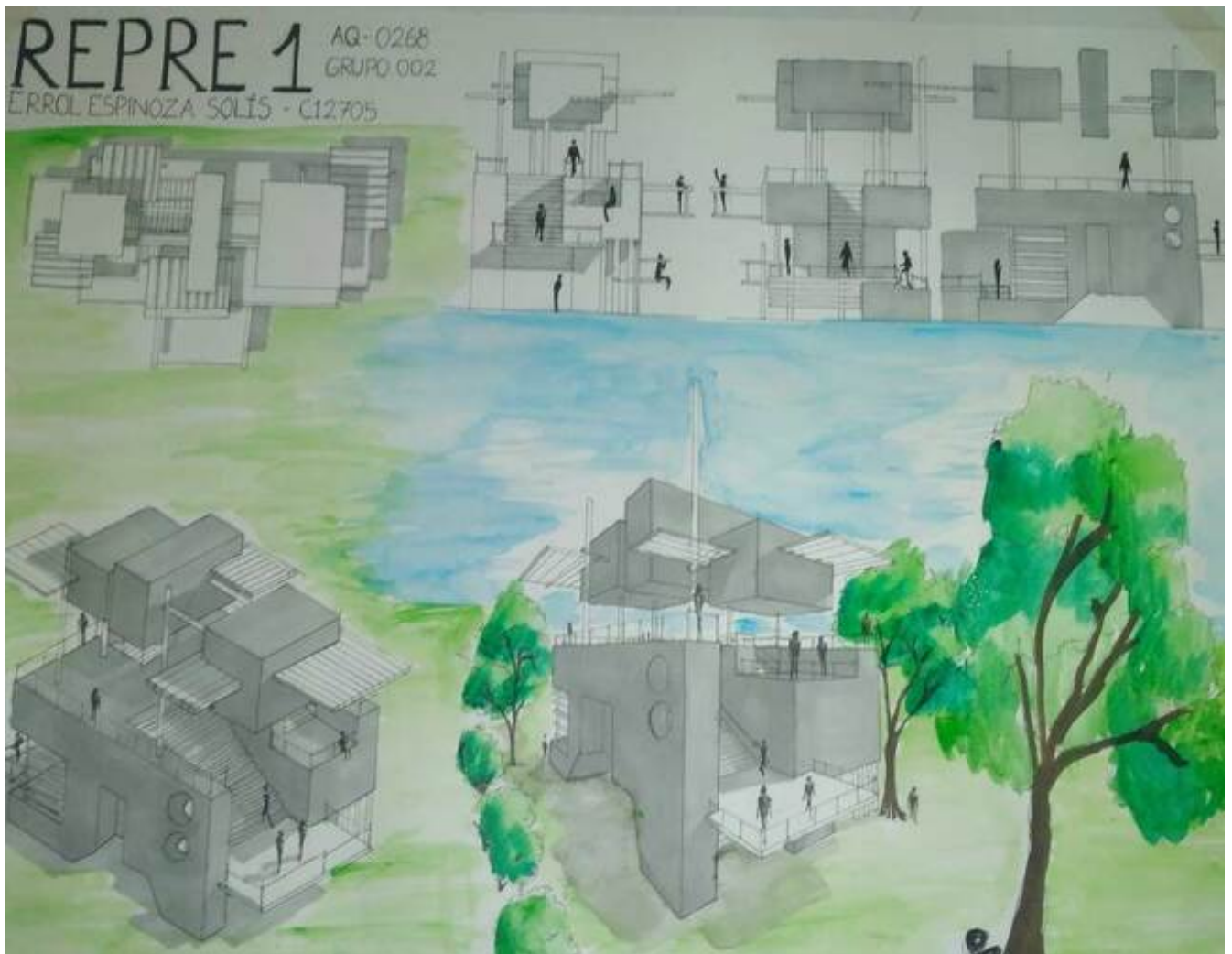
Trabajo realizado por Errol en el curso Representación tridimensional 1 sobre una vivienda.