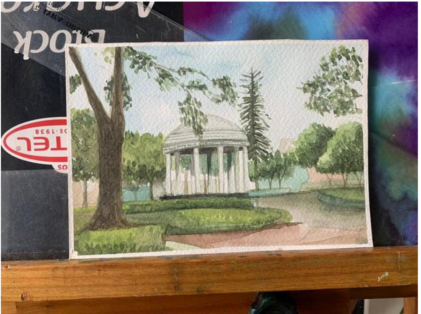
Acuarela del Templo de la Música en el Parque Morazán por María Laura.

Entrevista realizada el 24 de enero 2023.