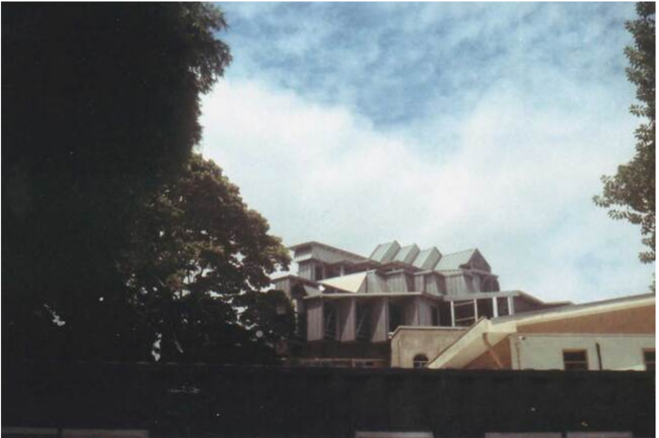
Fotografía del Edificio de Arquitectura UCR.

En este proceso de descubrirse a sí misma, ahorita que está en etapa de cerrar su proceso académico, ¿Cómo cree que le ha ayudado? o ¿Qué retos cree que van a venir de cara a una nueva etapa?