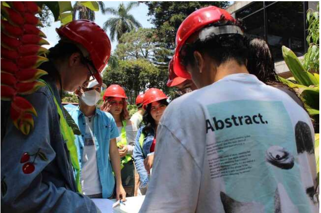
Estudiantes realizando molduras para paredes livianas de USC.