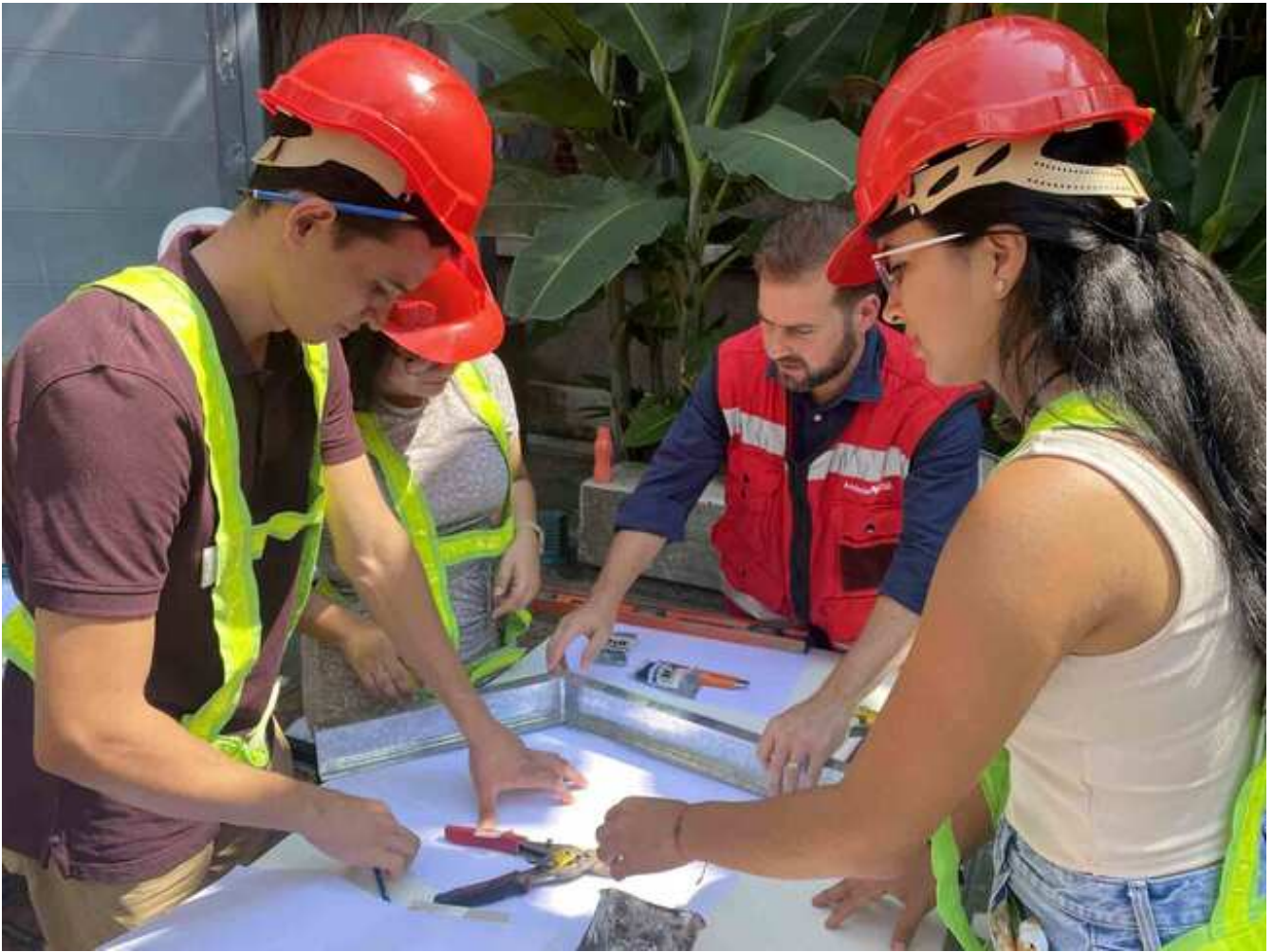
Estudiantes realizando paredes livianas USC.