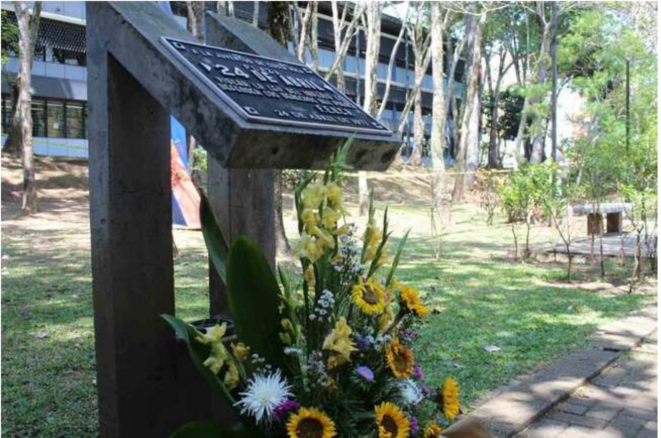
Placa Conmemorativa al 24 de Abril de 1871 con homenaje de girasoles.