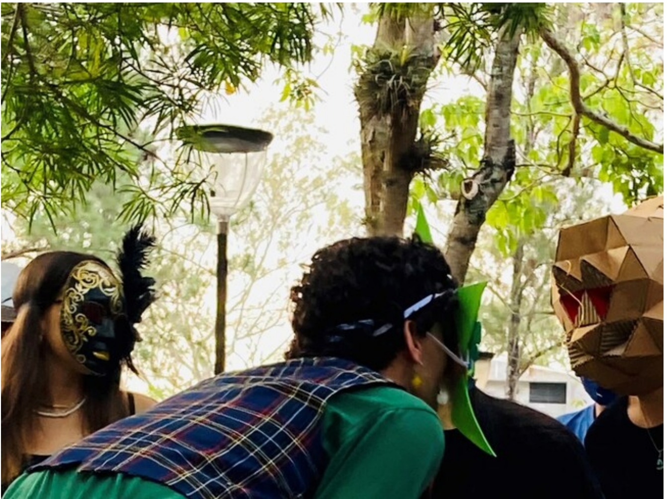
Performance de estudiantes de primer año en la Plaza 24 de Abril.

“La Asociación de Estudiantes de Arquitectura se siente muy complacida por haber concluido una semana universitaria arquis llena de actividades enriquecedoras. Nos complace pensar que los diferentes espacios de charlas, talleres prácticos y exposiciones ofrecidos en la escuela hayan fomentado el sano esparcimiento y promovido un mayor vínculo entre los diversos sectores de nuestra comunidad universitaria, como es propio de Semana U.