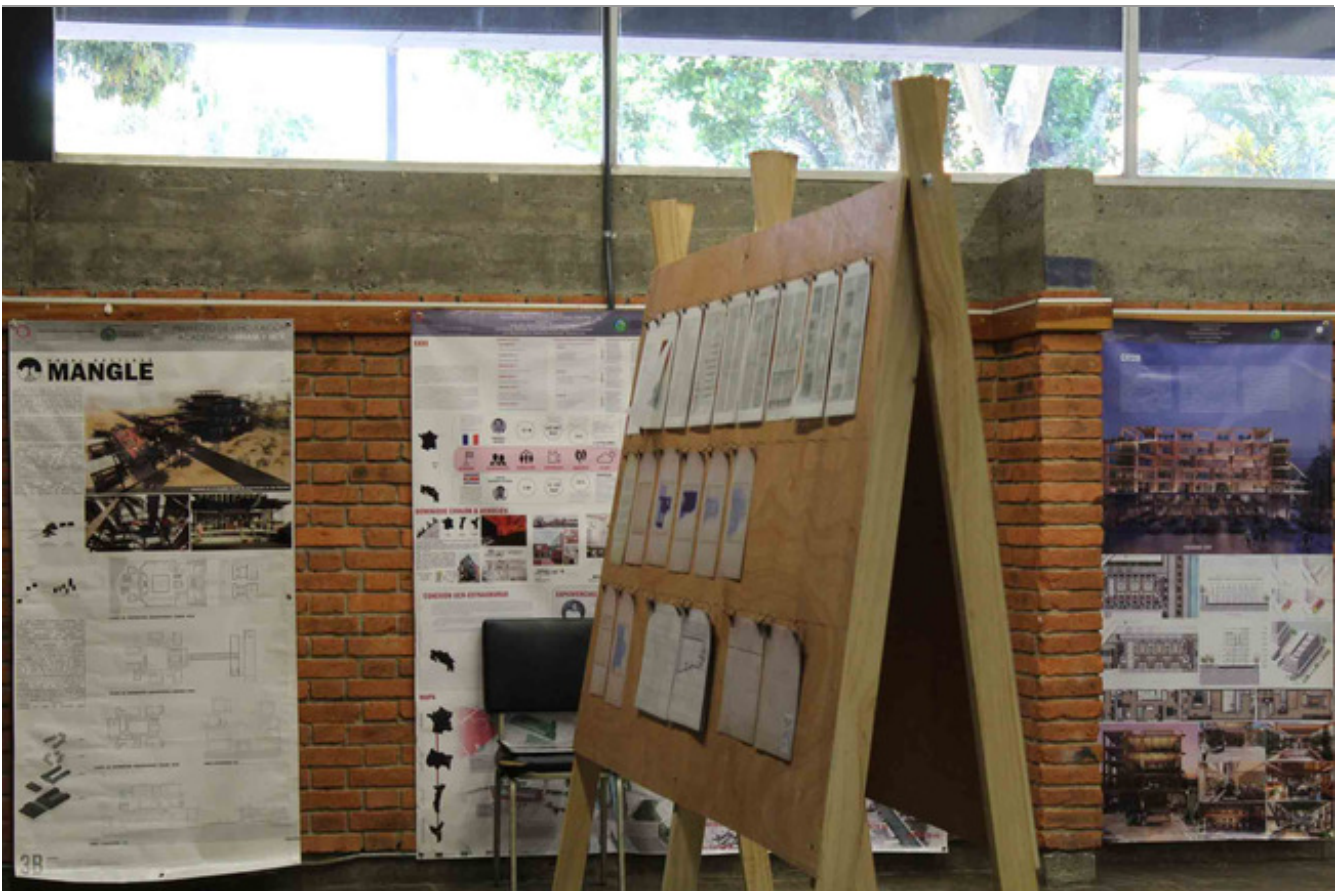
Exposición de trabajos realizados por estudiantes de UNAM como parte del proceso de internacionalización del ciclo avanzado de Arquitectura. Sala Expositiiones Bernal Madriz.