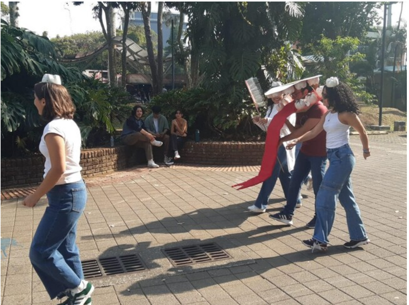
Pasacalles frente a Arquitectura.