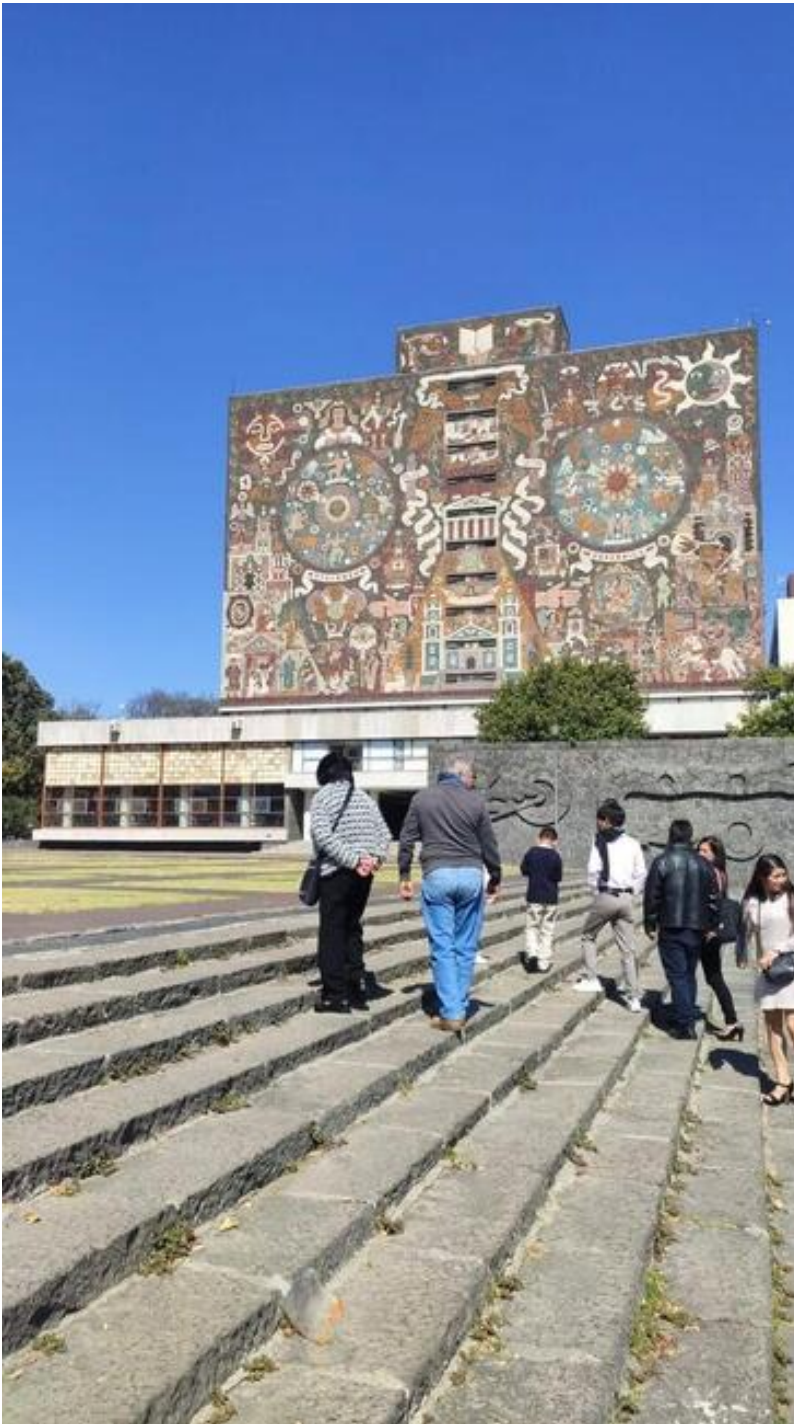
Fachada de Biblioteca Central UNAM.