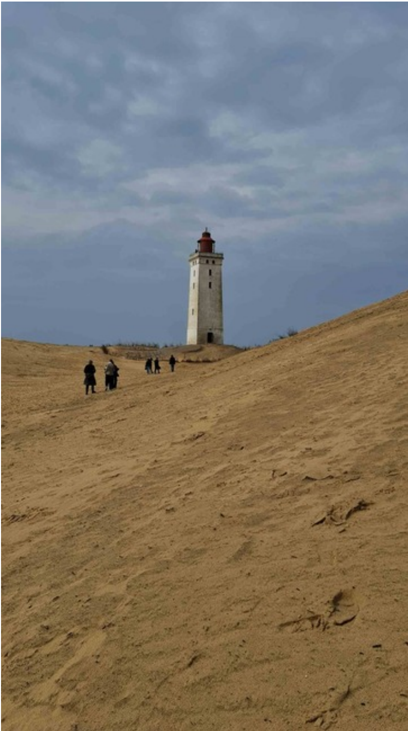
Atracción turística Rubjerg Knude Fyr.

Ser estudiante internacional en Aarhus University es sinónimo de muchas actividades, conocer muchísimas personas, participar de inducciones, actividades de bienvenida e incluso fiestas organizadas por el Student House, que podría compararse con la Federación de Estudiantes.