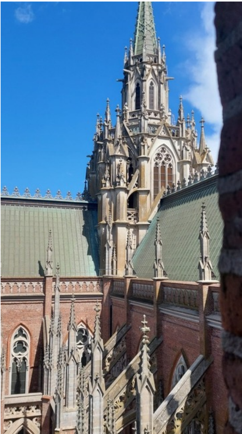
Exterior Catedral de la Plata, Argentina.

Estos primeros días de clases han estado llenos de riqueza cultural donde el intercambio de conocimiento y cultura se dan de una manera muy orgánica con personas de muchos lugares del mundo.