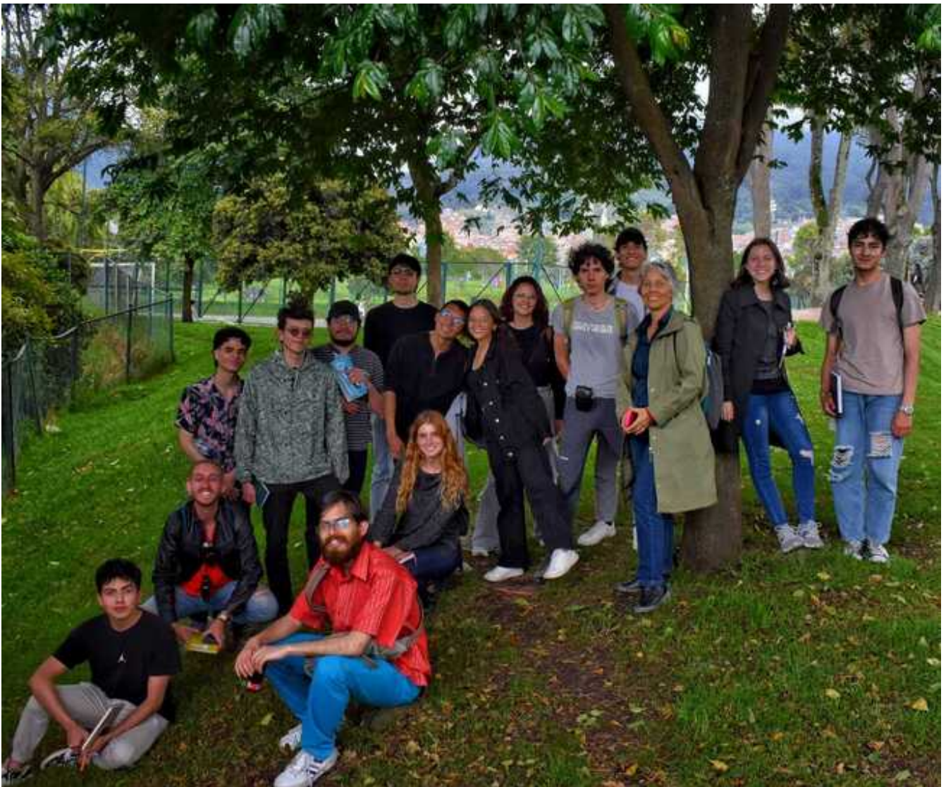
Profesora y compañeros de clase del curso La Calle.

Reconocer aspectos esenciales y particularidades que como usuarios podemos experimentar a la hora de recorrer una ciudad como la de Bogotá, prestar atención a las pequeñas cosas que me rodean, impactan e interesan tanto como usuario y futura arquitecta, analizando cada una de ellas dentro de un contexto en particular para comprender un poco más lo que en ella sucede y al mismo tiempo aumentando mi interés por la valoración del diseño no sólo del objeto arquitectónico como tal (edificio, vivienda...), sino también de todos aquellos elementos de diseño que le podrían acompañar a la hora de proponer su emplazamiento.