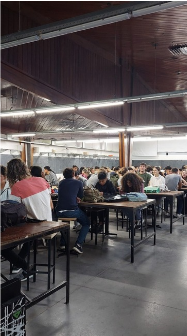
Espacio de clases en la Universidad de la Plata.