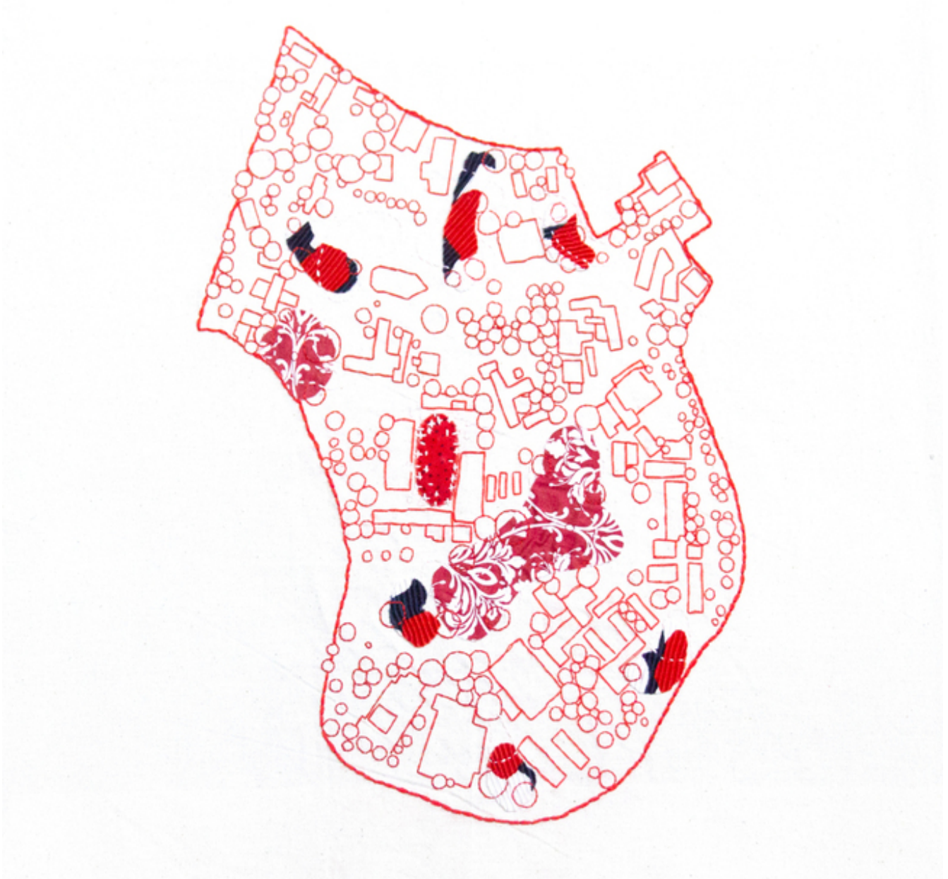
Figura 1. “Mi tanto”. Fuente: Julissa Santamaria Cubero.

“Mi tanto” es una obra que, a la vez que agradece, examina la Ciudad Universitaria Rodrigo Facio como espacio de recuerdos y bienestar. Usando lienzos, telas diversas e hilos rojos, Julissa traza las huellas y texturas de los principales edificios y espacios verdes que confieren un carácter especial a la Finca 1 (zona del Campus con un gran valor histórico y paisajístico). “Mi tanto” es un esfuerzo creativo y sensible por conectar y narrar la arquitectura, la ciudad y la naturaleza por medio de productos textiles.