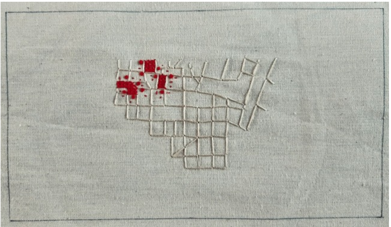
Figura 3. Exploraciones desde el bordado.