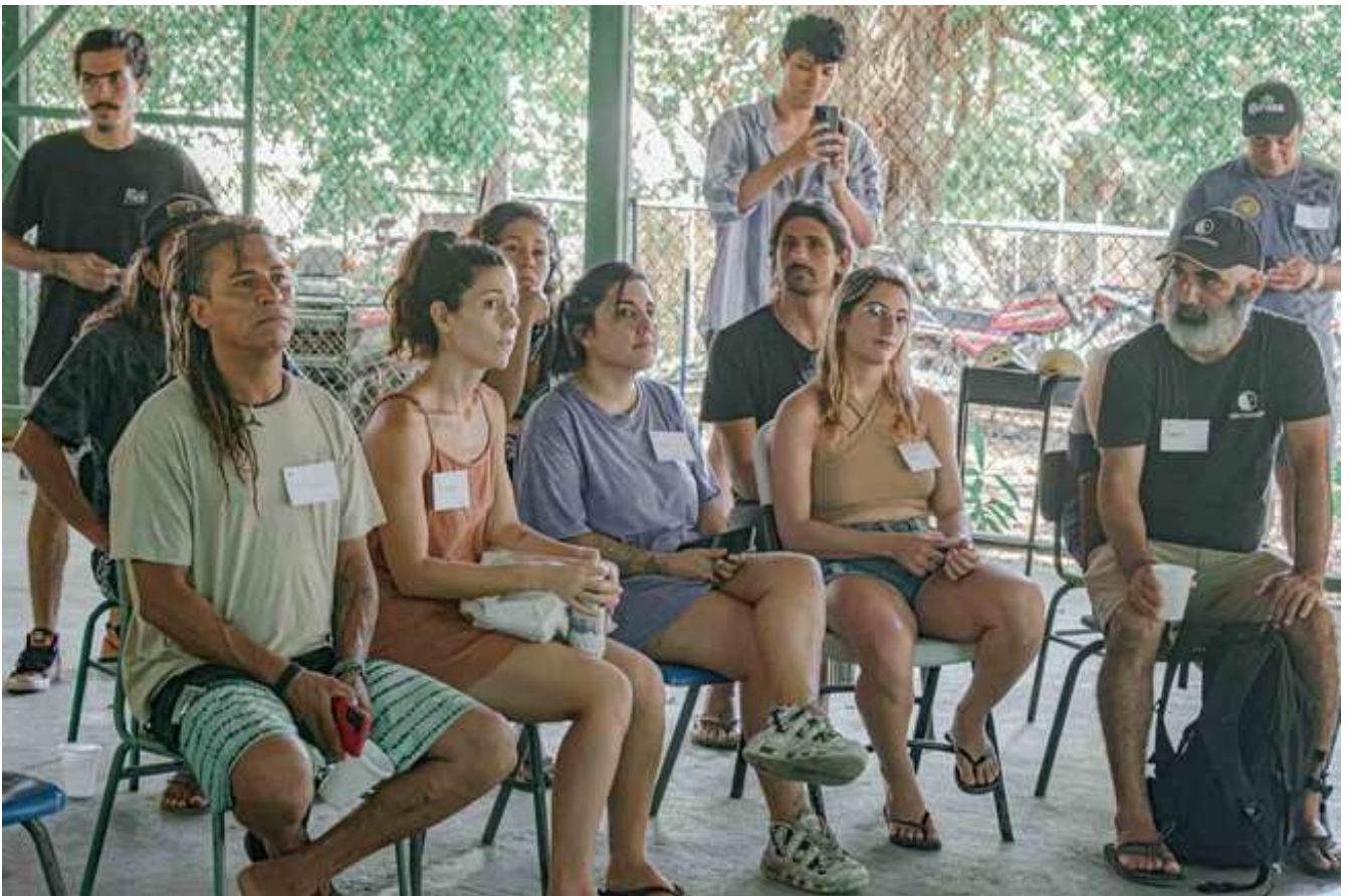
Trabajando con la comunidad de Santa Teresa