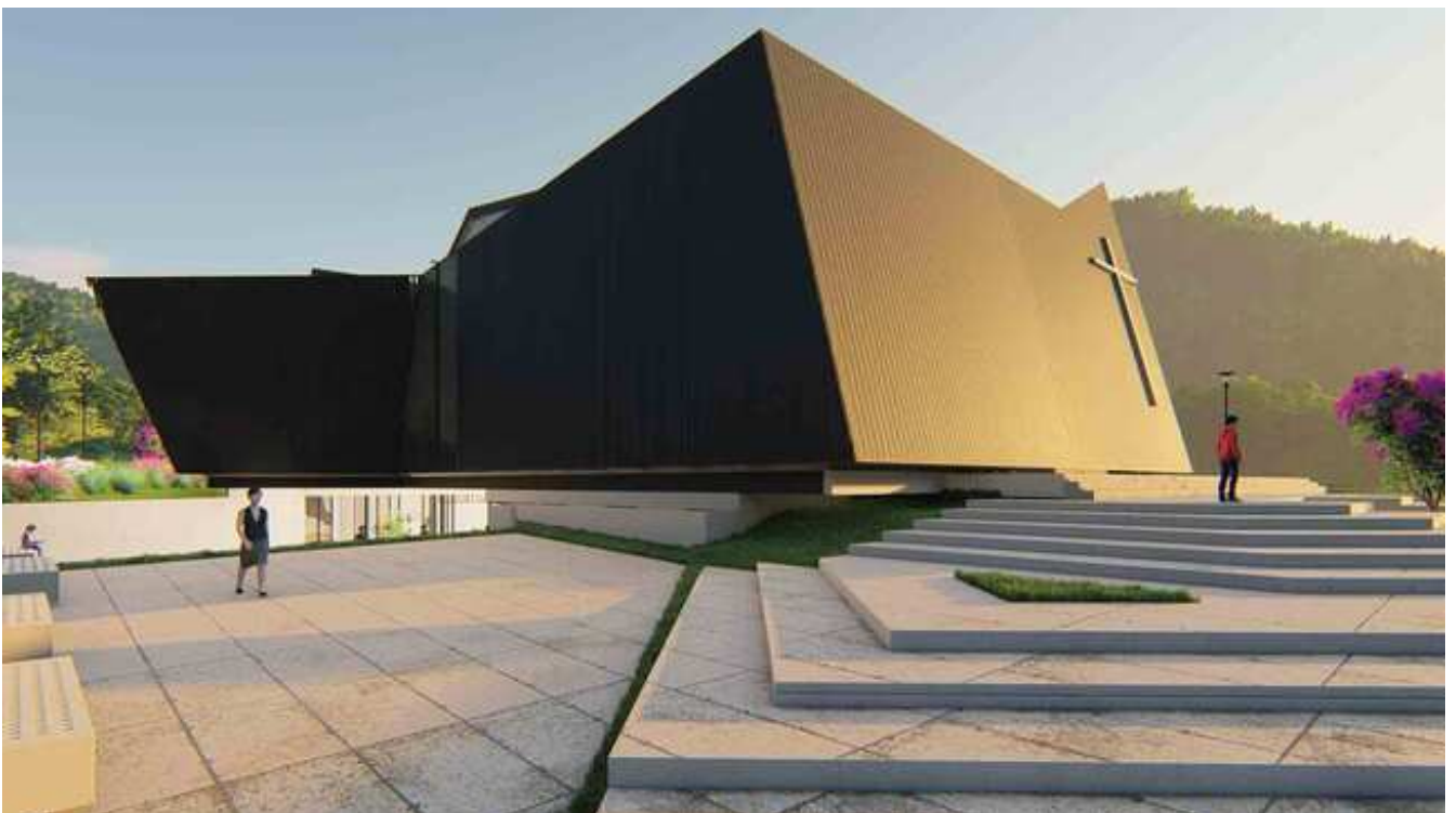
Render exterior de capilla de Sofía