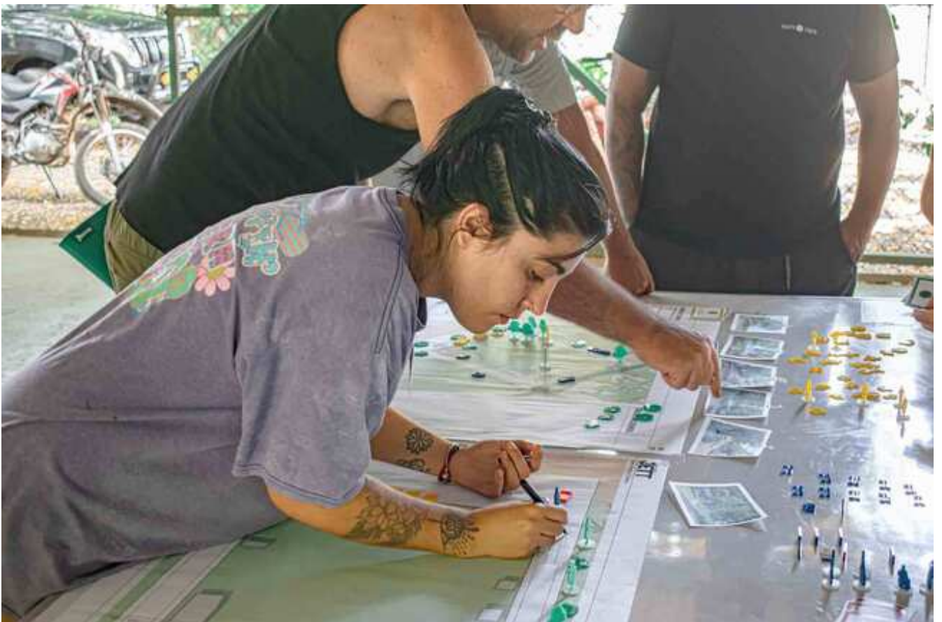
Participante de talleres participativos de JETT