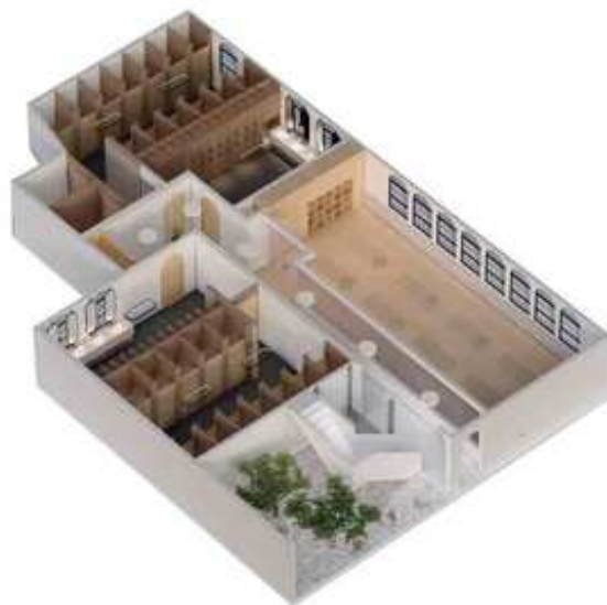
Isométrico de proyecto final de Joshua