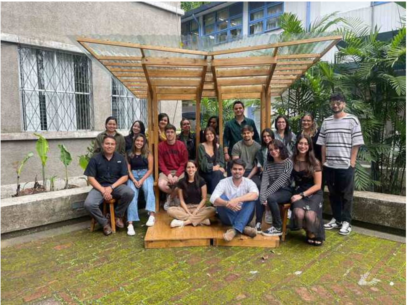
Equipo de taller en la parada de autobús afuera del edificio de Arquís, UCR