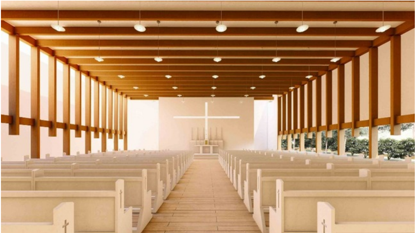
Render interior capilla proyecto final Nicolás