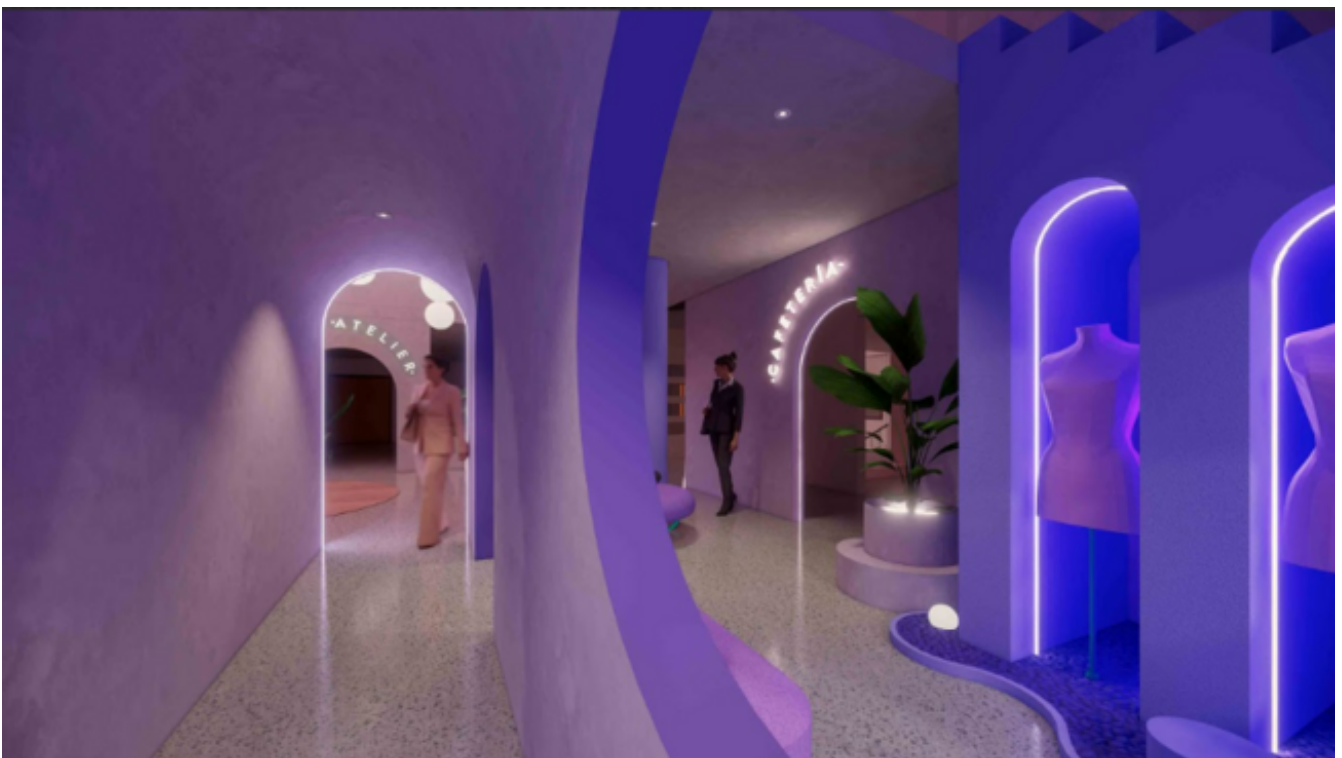
Renders del proyecto de Ricardo: Atelar Laboratorio de moda, Showroom

Mi experiencia en el taller de diseño profesional “Desde el interior” fue muy enriquecedora y gratificante en muchos aspectos, trabajar en equipo con futuras colegas, creó un espacio para inspirarnos y aprender juntxs, además de la libertad creativa y el acompañamiento por parte de las profesoras. Durante el semestre tuvimos la oportunidad de experimentar con biomateriales lo cual me generó una visión más amplia con respecto a la aplicación de estos en futuros proyectos, además la importancia de la innovación y sostenibilidad en el diseño. En el taller pude profundizar acerca del diseño interno, sus acabados, iluminación y especificaciones técnicas, donde además tuve la oportunidad de aplicar conocimientos multidisciplinarios en la arquitectura y como la moda y la construcción de la identidad de marca propia en el proyecto.