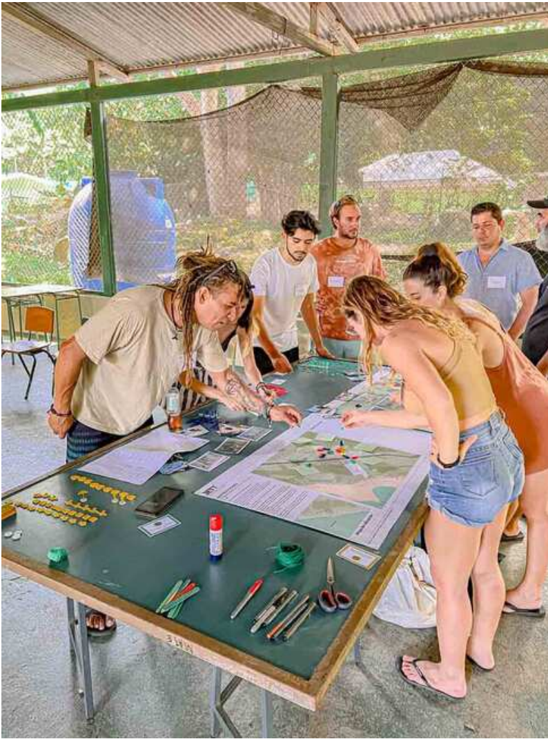
Taller Co-creativo con la comunidad en Santa Teresa