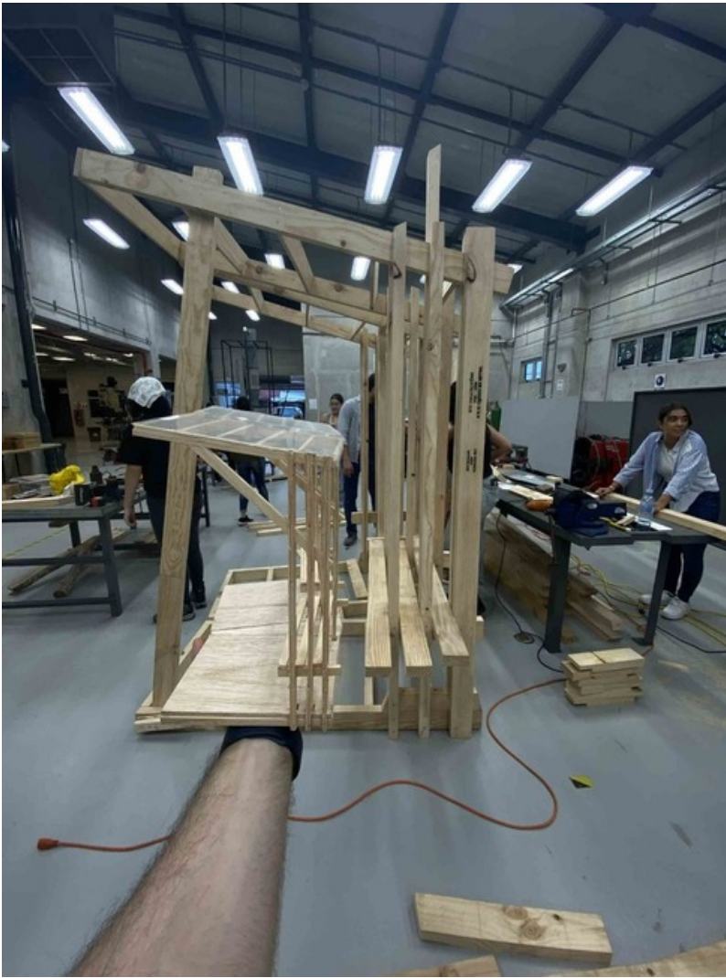
Prototipo a escala 1:1 de parada de autobús realizado en el taller de MAD-era