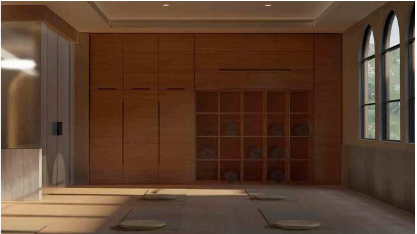
Mueble de proyecto entrega final de Joshua