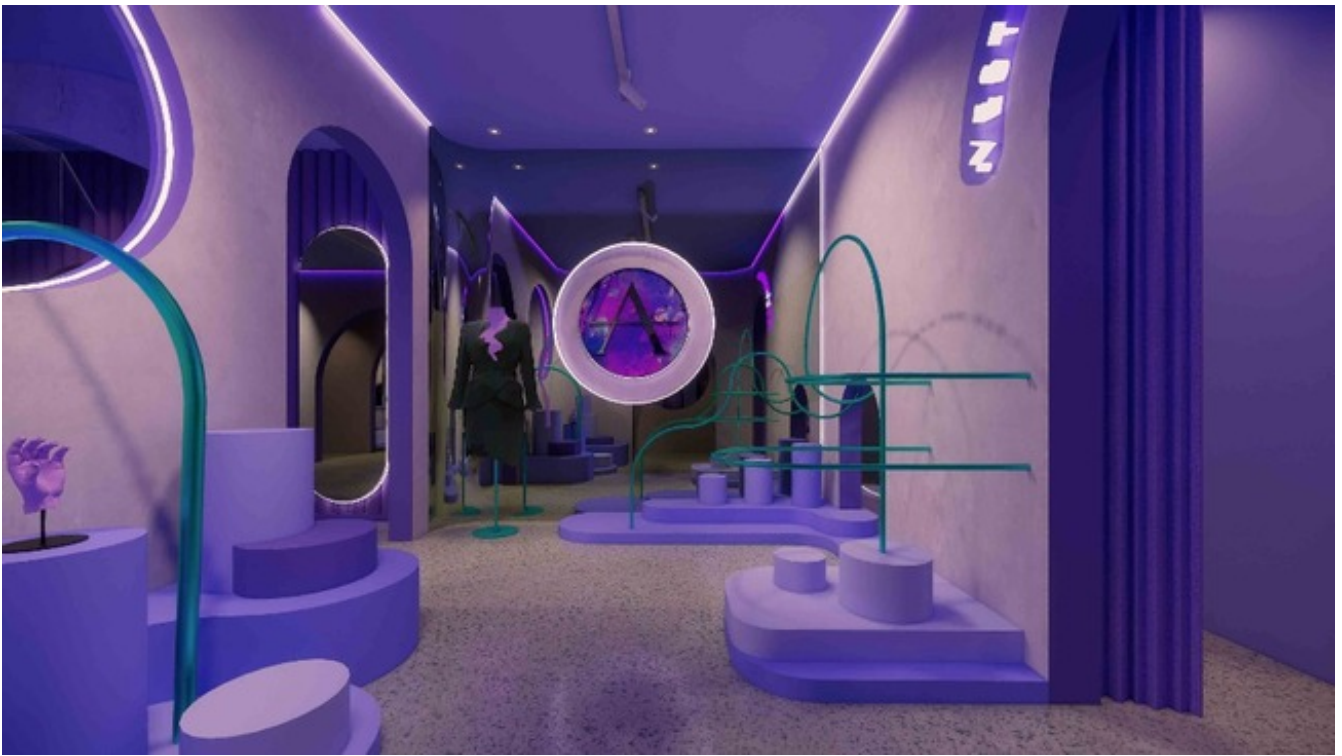
Renders del proyecto de Ricardo: Atelar Laboratorio de moda, Showroom