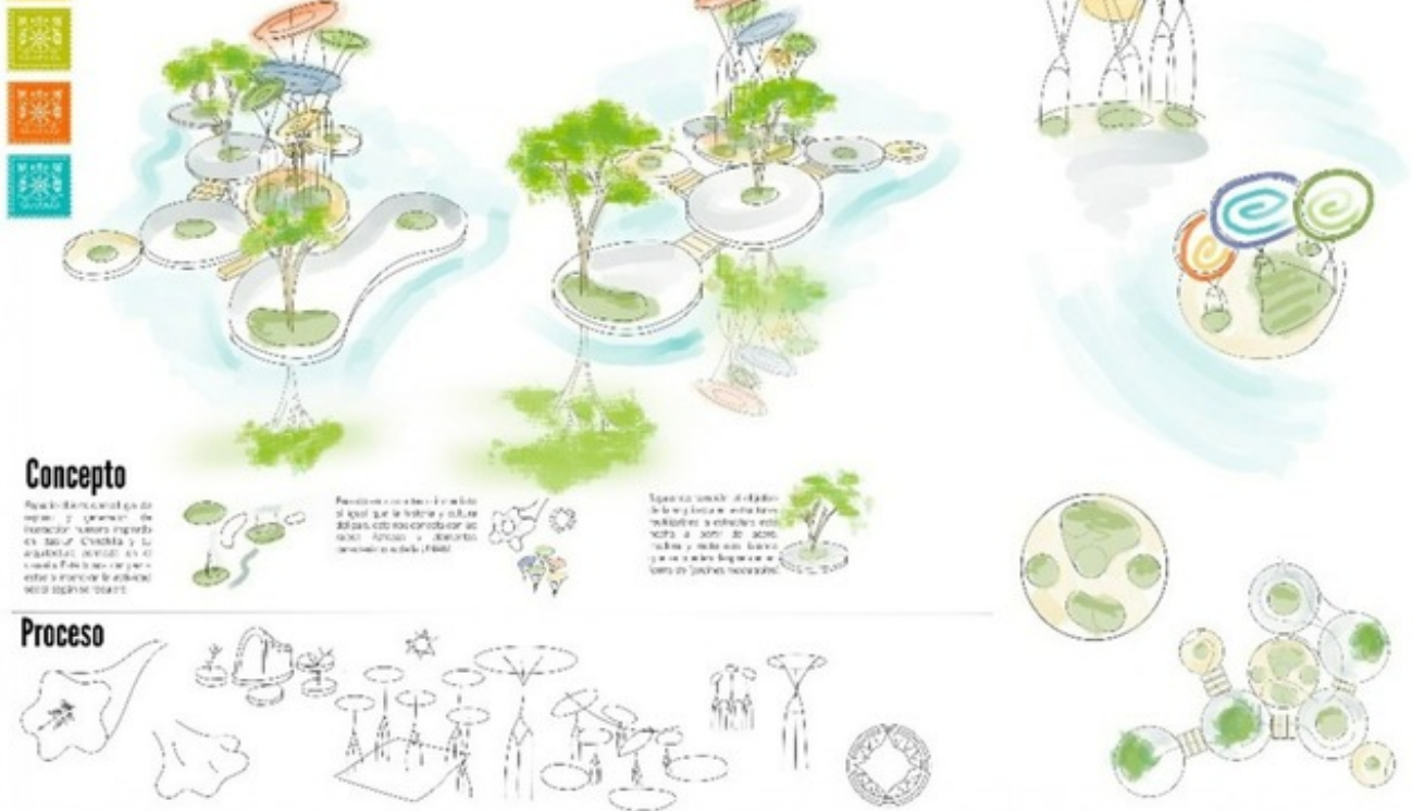
Propuesta "Jardín de los Cinco Soles". Concepto y proceso. Lámina 1 de 3.

El proyecto también siguiendo el contexto busca adaptarse a su ubicación en el Jardín Central de la UNAM, la Jacaranda siendo uno de los elementos simbólicos de la universidad fue utilizada para la morfología del espacio dando la forma de las plataformas y también estableciendo un eje principal para el elemento central, aprovechando también el uso de patrones florales por parte de Izaskun. Además inspirado en la creencia Azteca de que la humanidad ha vivido bajo 5 soles, se diseñó la parte superior de los soportes, representando cada uno un sol y todos fluyendo hacia el soporte central el cual representa el sol eterno bajo el que nosotros vivimos, siendo en la historia la unión de los Dioses que formaron estos primeros cuatro los que dieron en conjunto luz al quinto. La estructura central ofrece una experiencia visual y sensorial generando un espacio moldeable al usuario por medio de sus asientos de pasto y sus senderos, dando un relato sobre la cultura local. Los asientos de pasto dan la oportunidad al usuario también de involucrarse en el diseño del lugar que habitan, al ser asientos sin una dirección la decisión de estos va a terminar formando parte del ambiente.