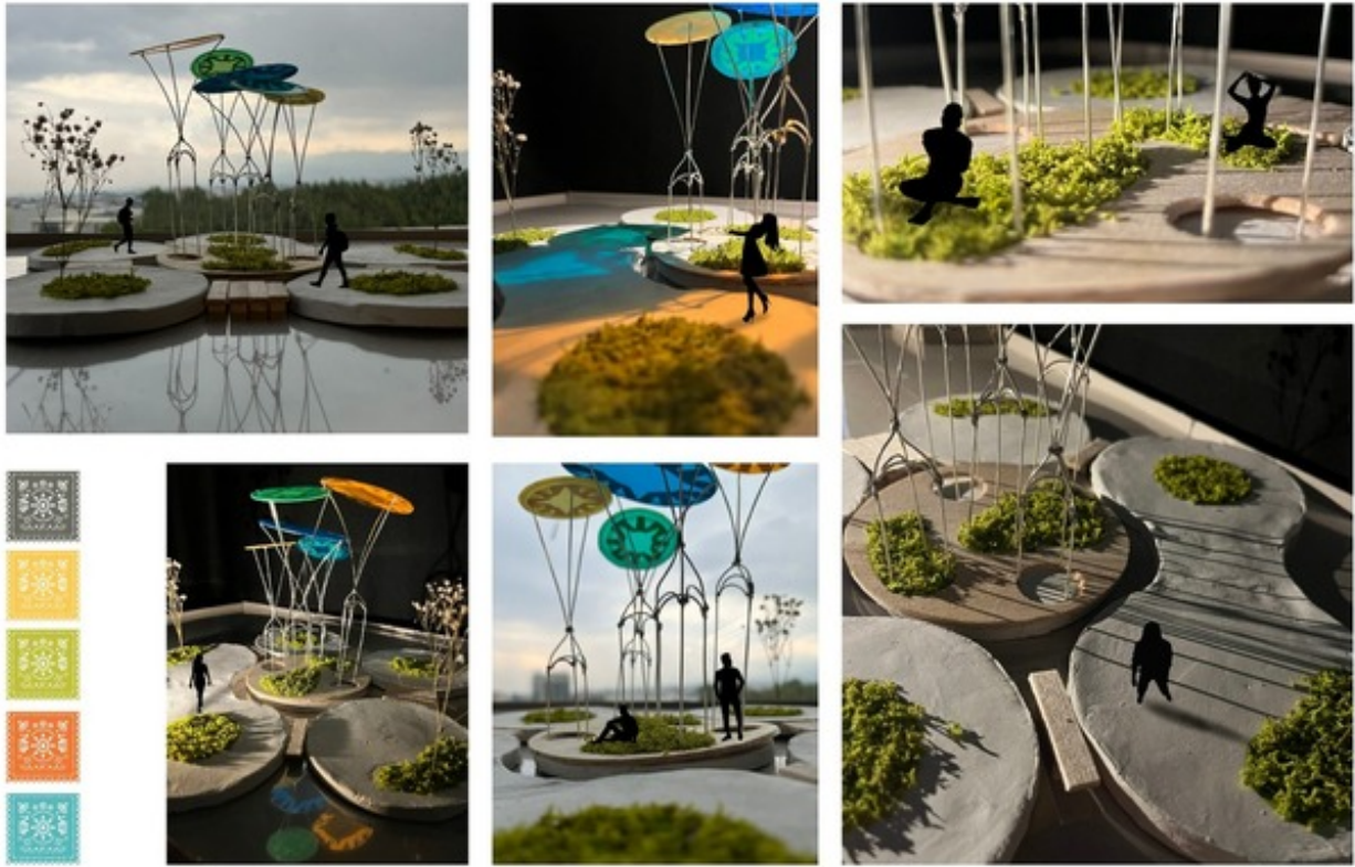
Propuesta "Jardín Cinco Soles". Fotografías de la maqueta. Lámina 3 de 3.